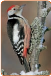
Mittelspecht: trommelt kaum, singt eine quäkende Strophe.

spechts. Bewohnt Laubwälder, bevorzugt Eichenwälder. Meidet Gebirgslagen. Nahrungserwerb hauptsächlich stochernd oder klaubend, weniger hackend als etwa beim Buntspecht.