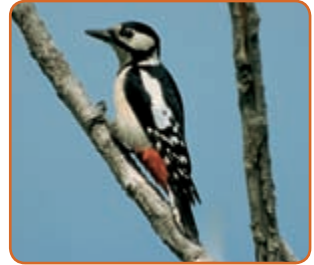
Buntspecht-♀ ohne Rot am Kopf, ruft und trommelt.

Kennzeichen. Gew. 90 g. Häufiger Specht mittlerer Größe in schwarzweißer Färbung. Oberseite schwarz mit großen weißen Schulterflecken. Wange mit hammerförmigem Zügelmuster (Blutspecht einfach winkelförmig). Oberkopf schwarz (♀) bzw. mit rotem Nackenfleck (♂) oder ganz rot mit schwarzer Umrandung (Jungvögel). Unterschwanz ziegelrot. Bearbeitet gerne Nüsse und Zapfen in »Spechtschmieden«. Flug tief wellenförmig.