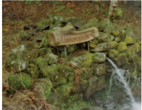
Quellfassung der Ulster am Heidelestein

Zunächst geht es durch den mittleren, dann den oberen Buntsandstein im Tal der jungen Ulster bergauf. Etwa dort, wo der Weg am Waldrand eine scharfe Linkskurve macht, beginnt oberhalb eine Muschelkalkabfolge. Die Wegbiegung liegt an einer Steilkante, die vom unteren Muschelkalk gebildet wird.