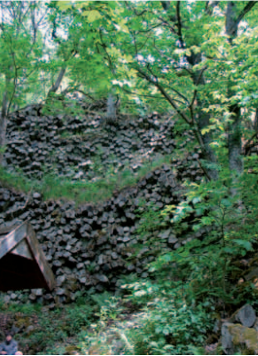
Die Prismenwand am Gangolfsberg

Das „Steinerne Haus“ bei Ginolfs bietet Blicke auf die ehemalige basaltische Land- oberfläche