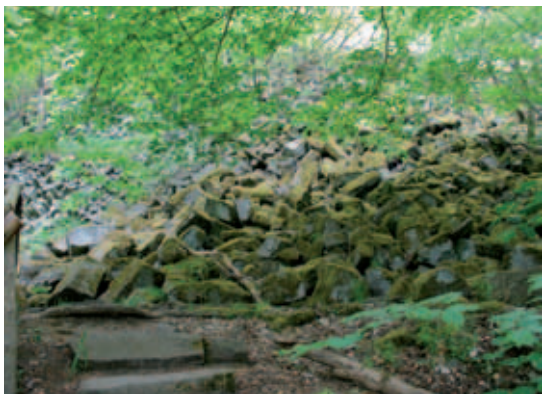
Blockschutt im Anstieg zur Prismenwand

tes stehen steil und sind im unteren Teil von Schuttmassen überdeckt. Für den Anstieg ist eine „Treppe“ aus Basaltsäulen gestaltet worden. Der Weg ist trotz des stabilen Geländers etwas beschwerlich, lohnt aber allemal. Die „Prismenwand“ zählt zu den schönsten Formationen dieser Art in der gesamten Rhön. Über die Entstehung gibt eine Informationstafel Auskunft.