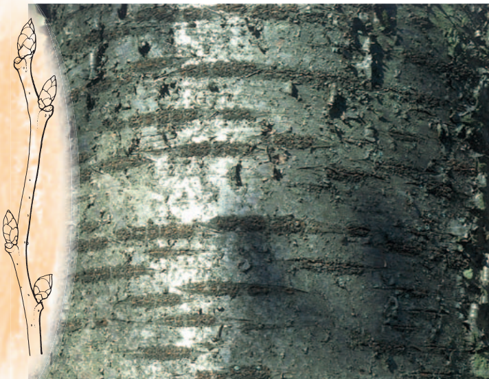
Abb. 72: Prunus avium . Zweigspitze.

Verbreitung: Europa und über das nördliche Kleinasien zur Krim und zum Kaukasus.