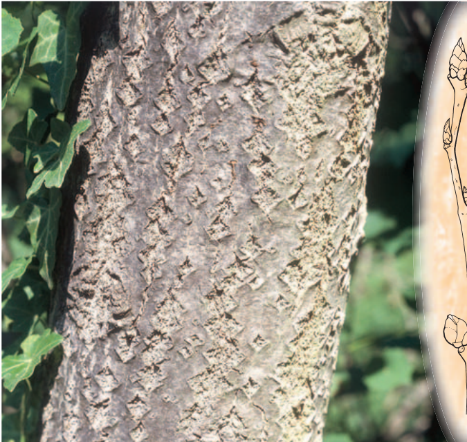
Abb. 71: Populus tremula . Zweigspitze mit Blattknospen und einer Blütenstandsknospe.

Verbreitung: Europa bis Sibirien und Kleinasien.